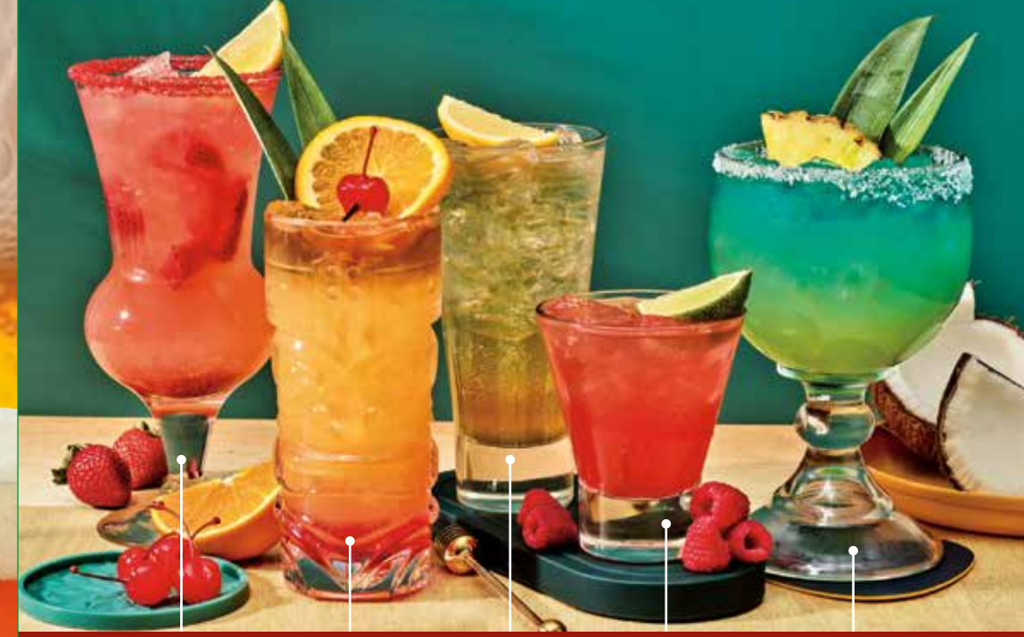
SPIKED FRECKLED LEMONADE®

2,000 calorías al día es la recomendación general nutricional, pero las necesidades calóricas varían.